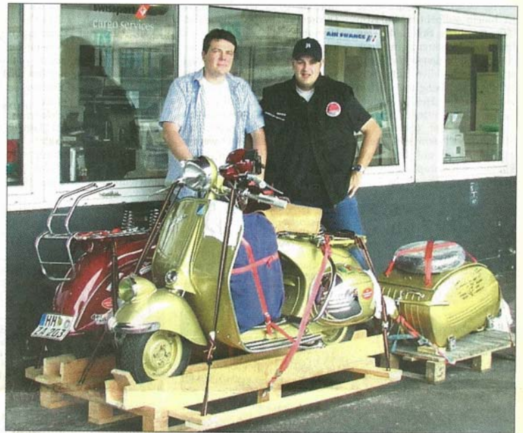
Die Vespa-Abenteurer Christian Z■■■■ (links) und Hendrik H■■■■ checken ihre Hoffmann Königinnen auf dem Hamburg Airport für ihren USA-Trip ein. Sie wollen 16000 Kilometer durch die USA reisen. Näheres unter www.america-by-vespa.com .

Hendrik und Christian sind seit dem vergangenen Wochenende unterwegs. Nach einem „Abstecher“ zu den Vespa World Days am 16. und 17. Juni im Zwergstaat San Marino landeten die beiden am Montag, 18. Juni, in New York. Ihre beiden Hoffmann Königinnen hatten sie schon eine Woche vorher bei der Air France am Hamburg Airport einge-